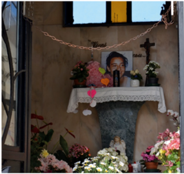
Das Grab der seligen Chiara ↑ (Luce) Badano in Sassello.